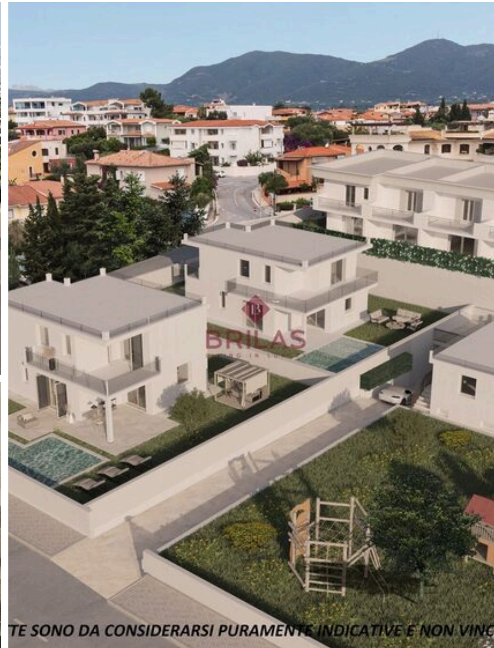
TE SONO DA CONSIDERARSI PURAMENTE INDICATIVE E NON VINCO