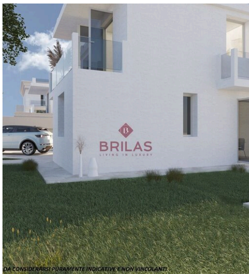
DA CONSIDERARSI PURAMENTE INDICATIVE E NON VINCOLANTI