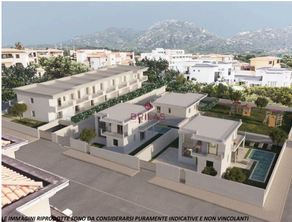
LE IMMAGINI RIPRODOTTE SONO DA CONSIDERARSI PURAMENTE INDICATIVE E NON VINCOLANTI