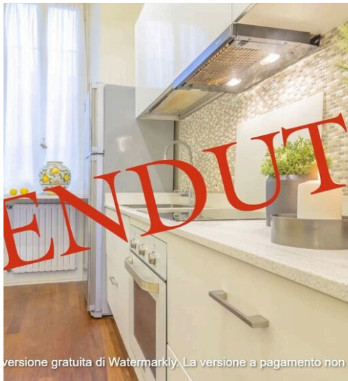
versione gratuita di Watermarkly. La versione a pagamento non