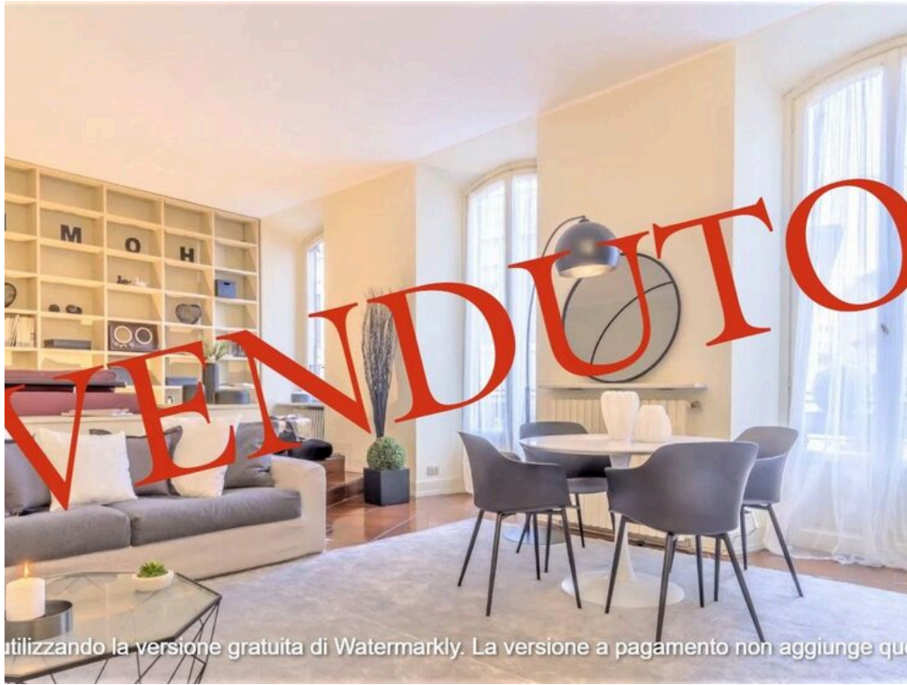
utilizzando la versione gratuita di Watermarkly. La versione a pagamento non aggiunge que