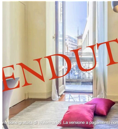
versione gratuita di Watermarkly. La versione a pagamento non