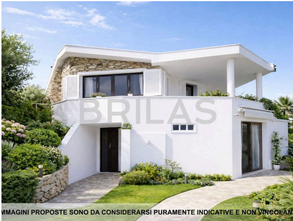
IMMAGINI PROPOSTE SONO DA CONSIDERARSI PURAMENTE INDICATIVE E NON VINCOLANTI