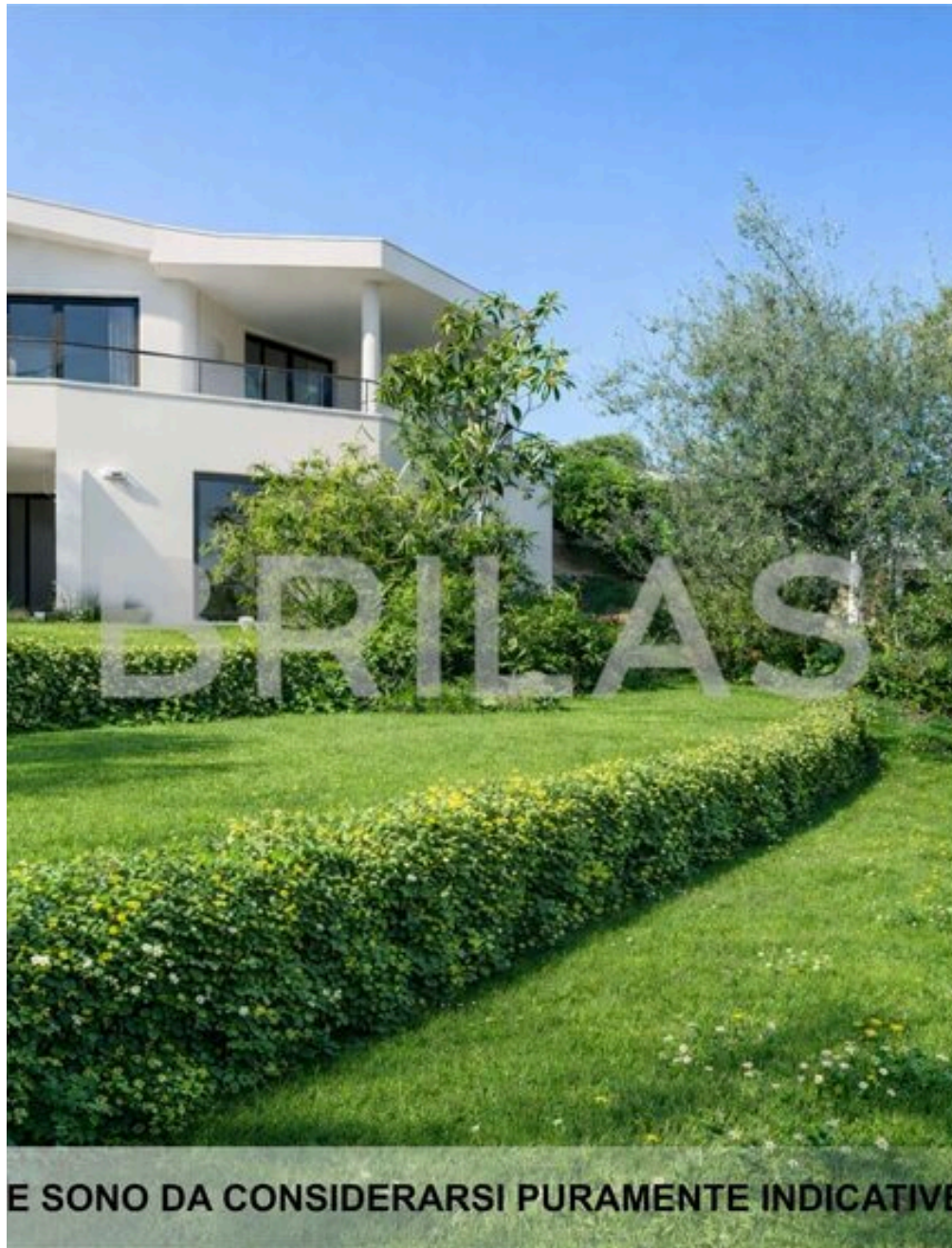
IMMAGINI PROPOSTE SONO DA CONSIDERARSI PURAMENTE INDICATIVE E NON VINCOLANTI