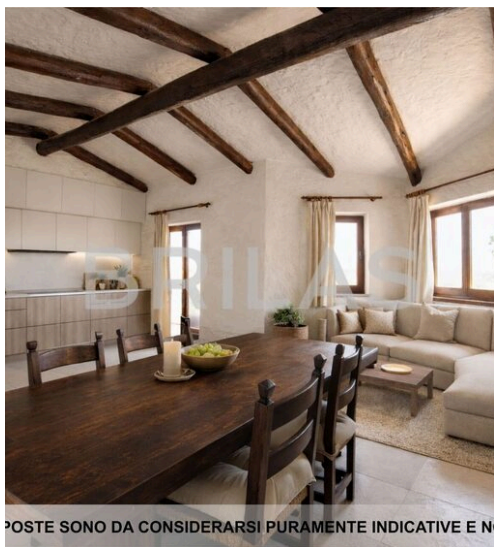
IMMAGINI PROPOSTE SONO DA CONSIDERARSI PURAMENTE INDICATIVE E NON VINCOLANTI