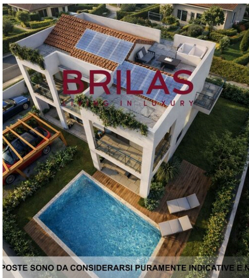
LE IMMAGINI PROPOSTE SONO DA CONSIDERARSI PURAMENTE INDICATIVE E NON VINCOLANTI