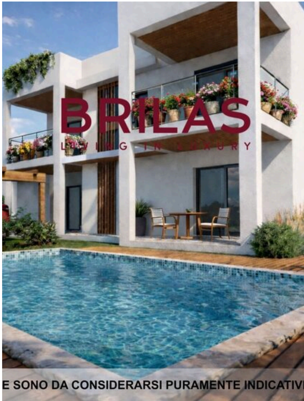
LE IMMAGINI PROPOSTE SONO DA CONSIDERARSI PURAMENTE INDICATIVE E NON VINCOLANTI