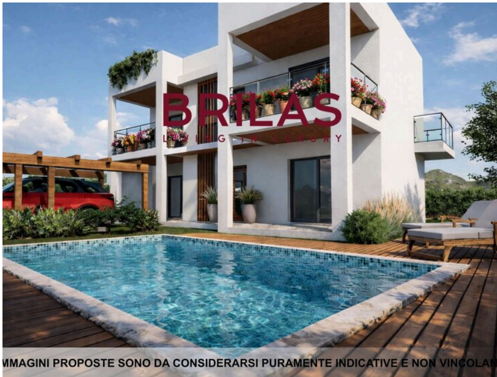
IMMAGINI PROPOSTE SONO DA CONSIDERARSI PURAMENTE INDICATIVE E NON VINCOLANTI