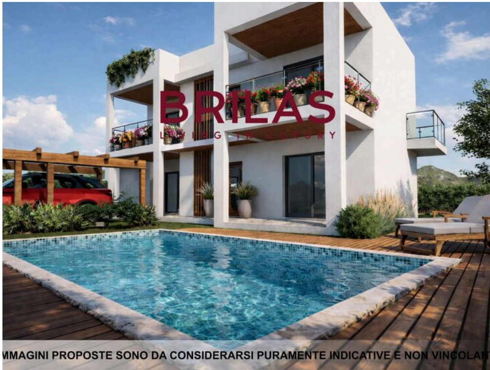
IMMAGINI PROPOSTE SONO DA CONSIDERARSI PURAMENTE INDICATIVE E NON VINCOLANTI