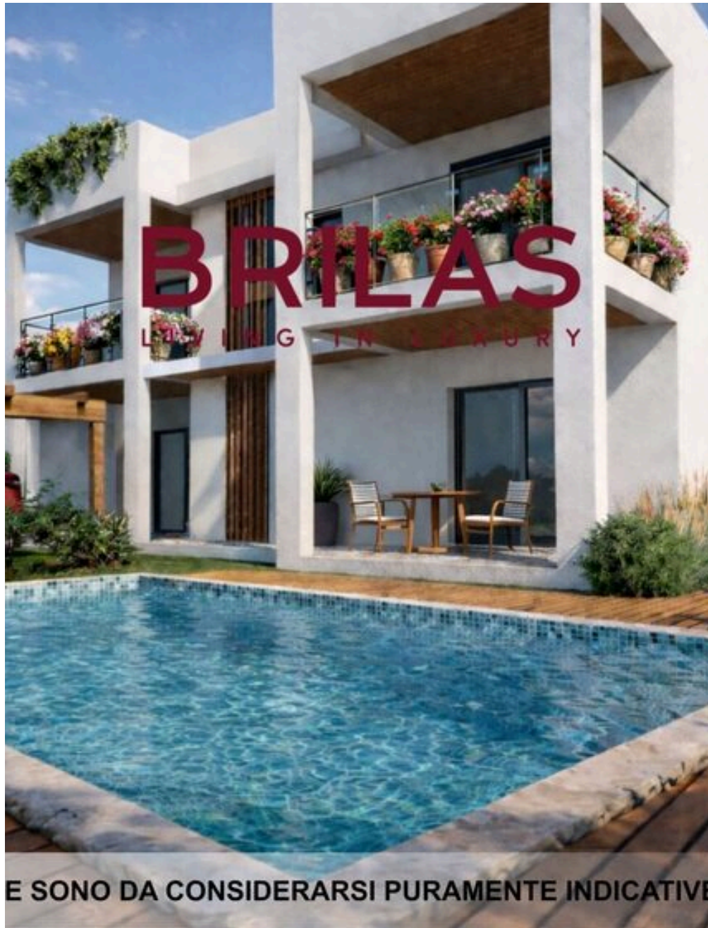
IMMAGINI PROPOSTE SONO DA CONSIDERARSI PURAMENTE INDICATIVE E NON VINCOLANTI