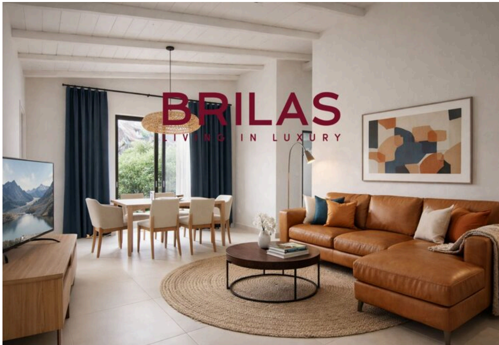
IMMAGINI PROPOSTE SONO DA CONSIDERARSI PURAMENTE INDICATIVE E NON VINCOLANTI