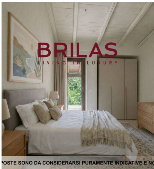
IMMAGINI PROPOSTE SONO DA CONSIDERARSI PURAMENTE INDICATIVE E NON VINCOLANTI