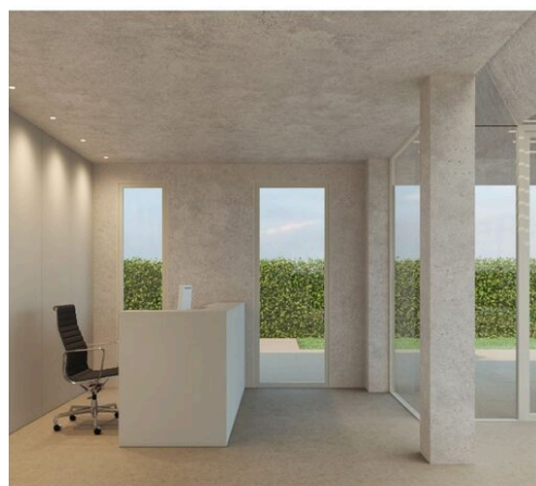
Architr Ideas and projects