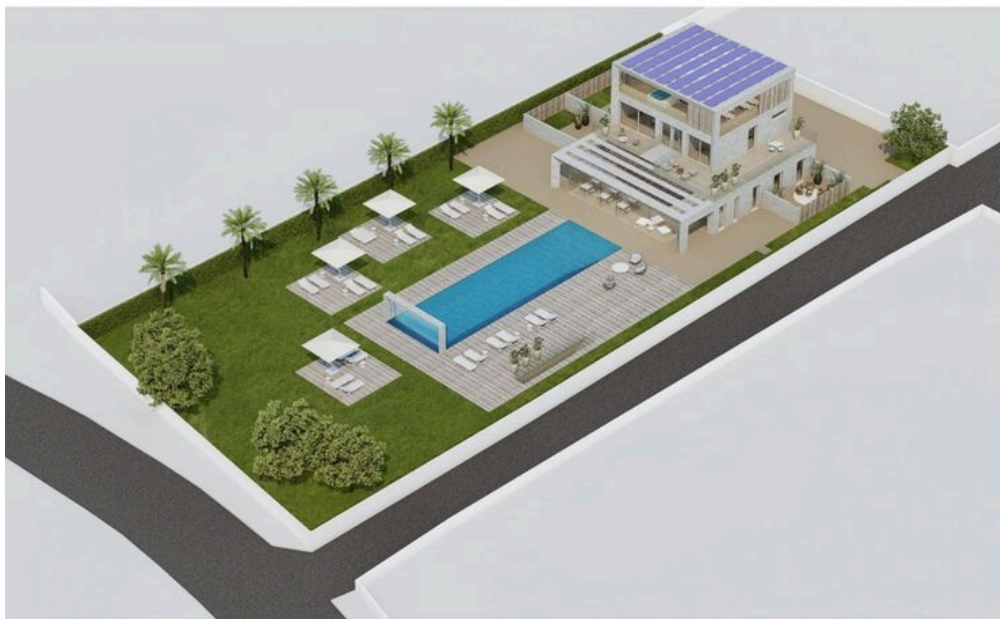
Architrend Architect Ideas and projects in contemporary architecture