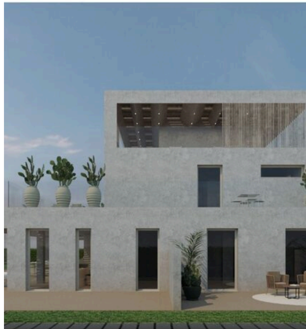
Architr Ideas and projects