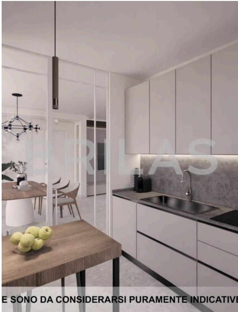
IMMAGINI PROPOSTE SONO DA CONSIDERARSI PURAMENTE INDICATIVE E NON VINCOLANTI