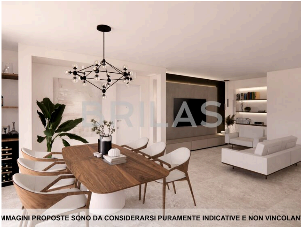
IMMAGINI PROPOSTE SONO DA CONSIDERARSI PURAMENTE INDICATIVE E NON VINCOLANTI