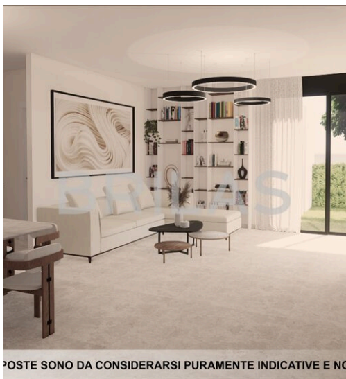
IMMAGINI PROPOSTE SONO DA CONSIDERARSI PURAMENTE INDICATIVE E NON VINCOLANTI