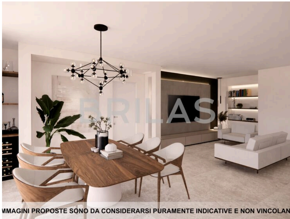
IMMAGINI PROPOSTE SONO DA CONSIDERARSI PURAMENTE INDICATIVE E NON VINCOLANTI