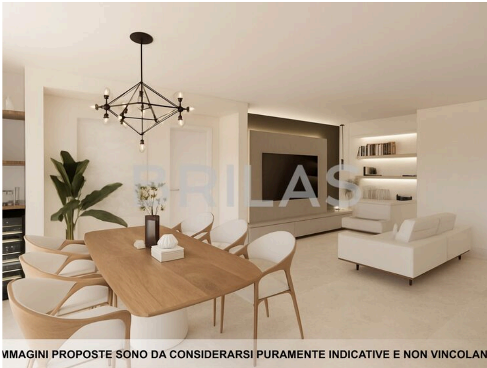
IMAGINI PROPOSTE SONO DA CONSIDERARSI PURAMENTE INDICATIVE E NON VINCOLANTI