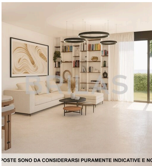
IMAGINI PROPOSTE SONO DA CONSIDERARSI PURAMENTE INDICATIVE E NON VINCOLANTI