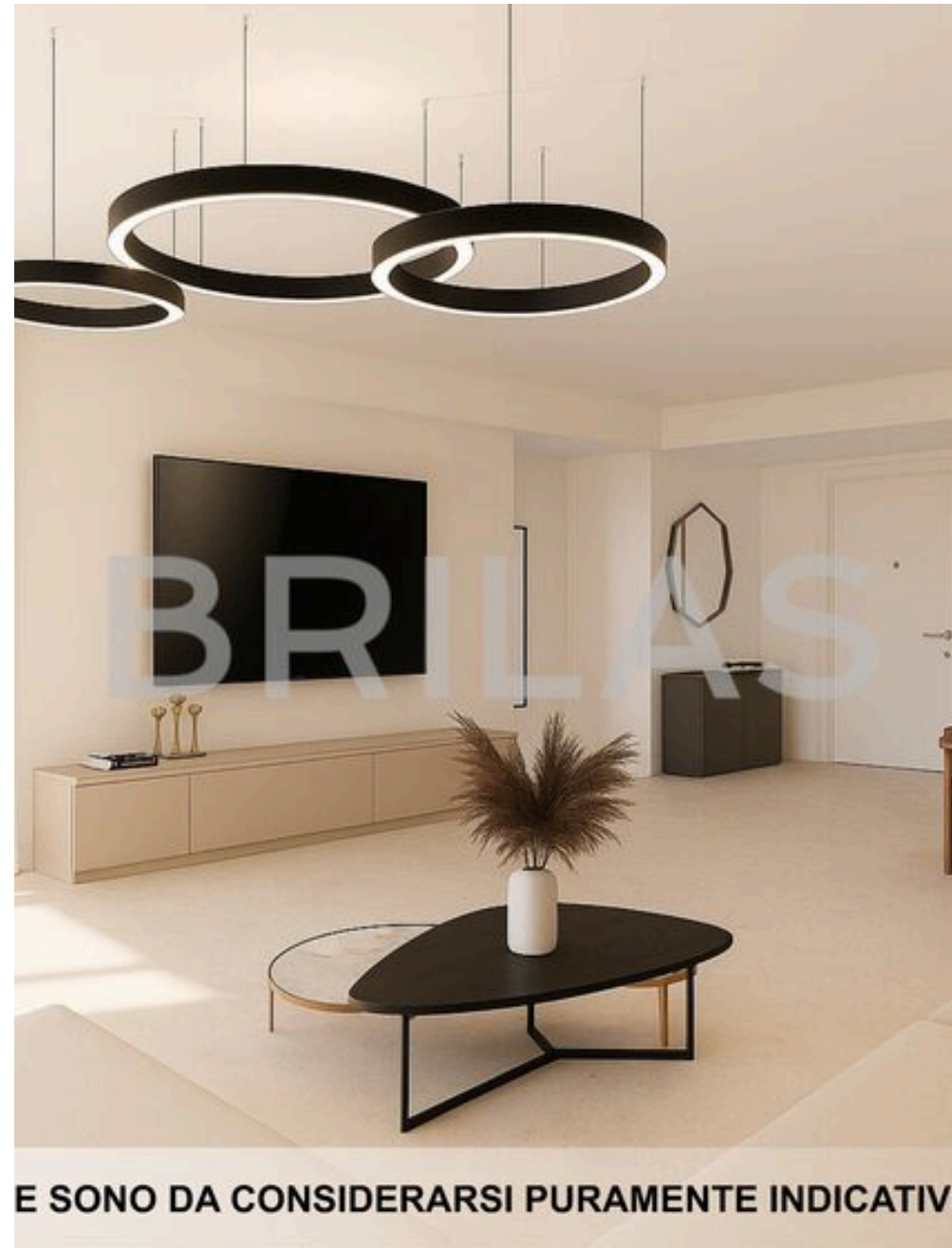
IMAGINI PROPOSTE SONO DA CONSIDERARSI PURAMENTE INDICATIVE E NON VINCOLANTI