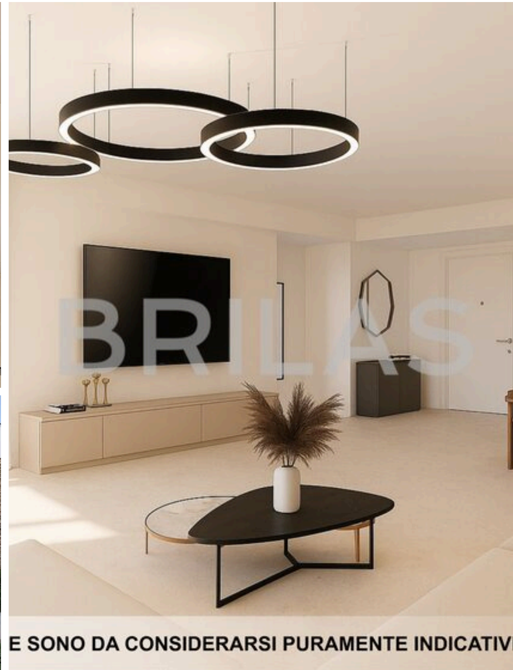
IMMAGINI PROPOSTE SONO DA CONSIDERARSI PURAMENTE INDICATIVE E NON VINCOLANTI